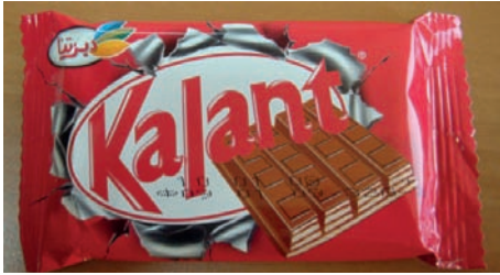
«كالانت» المنتج الذي يحمل علامة مشابهة لـ «كيتكات»

أدانت الرئيسة هنادي جابر، القاضي المنفرد الجزائي في طرابلس، مدعى عليهم بجرم بيع منتج «كالانت» المشابه «لكيتكات»، مبطلّة ذرائع المدعى عليهم بكون المنتج مصنعا في سوريا بصورة رسمية وأصولية، على اعتبار ان للماركة المسجلة أولويتها في الحماية من أي منافسة تقليداً أو تشبيهاً.