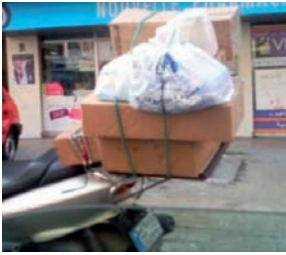
بيع الادوية على الدرجات النارية