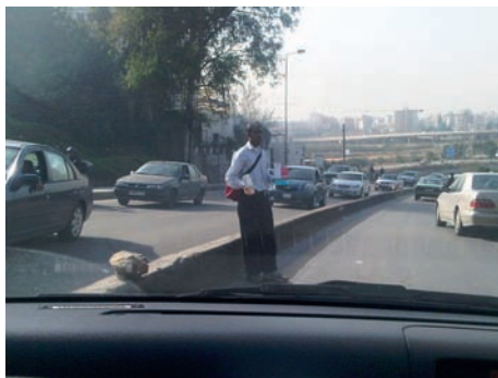
بيع عطور مقلدة على الطرقات

بناءً على شكوى من شركة عالمية متخصصة في انتاج مستحضرات التجميل وبيعها، اوقف مكتب مكافحة جرائم المعلوماتية وحماية الملكية الفكرية مدعى عليه اثناء قيامه بتوصيل طلبية من مستحضرات تجميل تحمل علامات مقلدة للشركة المدعية. وتبين في المحاكمة ان الموقوف لم يكن قد مضى على عمله لدى مدعى عليه ثان سوى اسبوع، وانه كان يجهل ان البضائع التي كان يوصلها مقلدة فقد كان يستلم من الاخير اكياساً كل منها مخصص لزبون يوصلها ويستلم ثمنها.